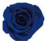
サファイヤブルー