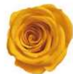
サフランイエロー