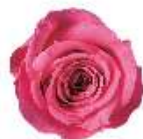
ピンクフランボワーズ